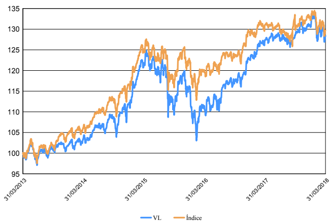
Evolución del Valor Liquidativo de los Últimos 5 años

Índice: 50%MSCI World +40%JP EMU 3-5 +10% EO*